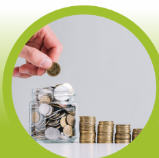
Prijzen | tarieven