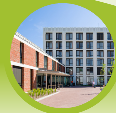
Verbouwing of verhuizing